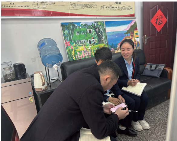
定期与教体局汇报交流