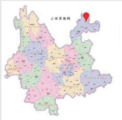
位于云南省东北部

盐津县，于云南省东北部，属昭通市下辖县，因曾拥有盐井产盐并设渡口渡汛而得名。全县总面积 2091.5 平方公里，全县常住总人口 31.26 万人（源于第七次人口普查数据）。