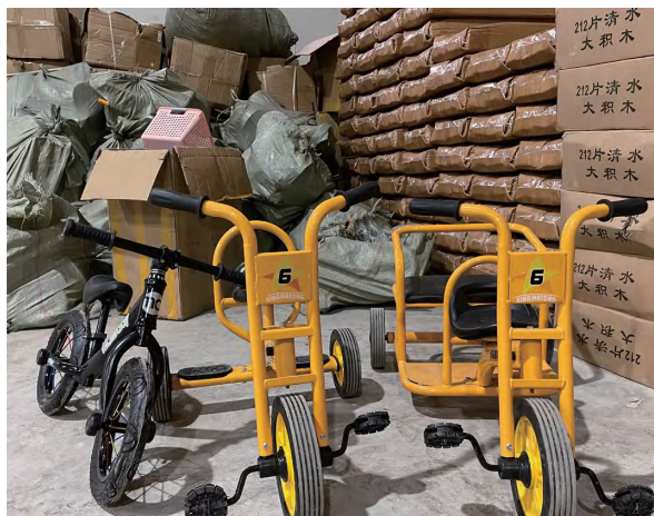
补充和完善幼儿班硬件设施