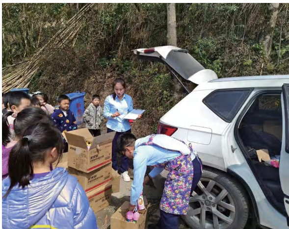
督导过程为幼儿班分发物资