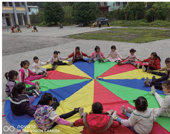
幼儿班丰富多样的户外游戏活动