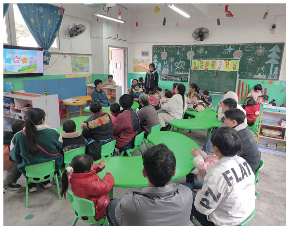
幼儿班组织家长会议