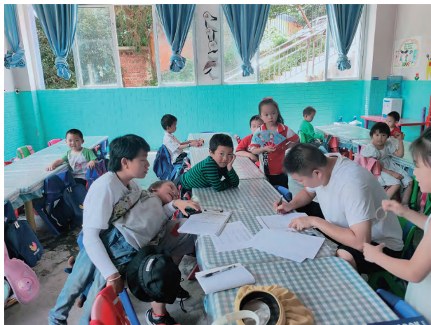
项目前期基线调研