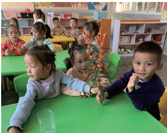
教师利用玩教具引导幼儿自主探索与发现