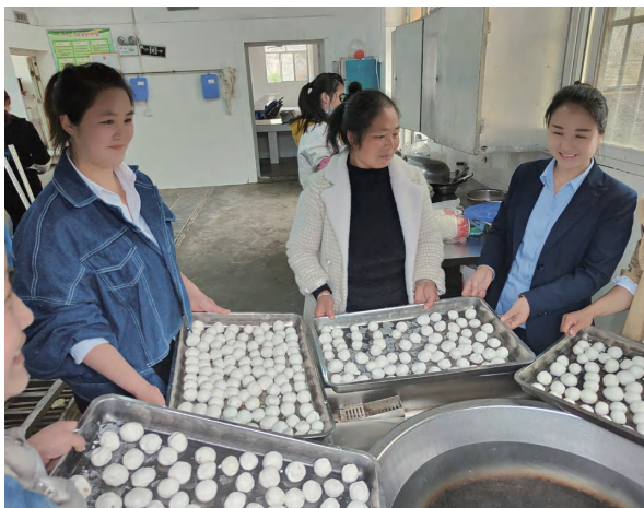
家长开放日动手做汤圆