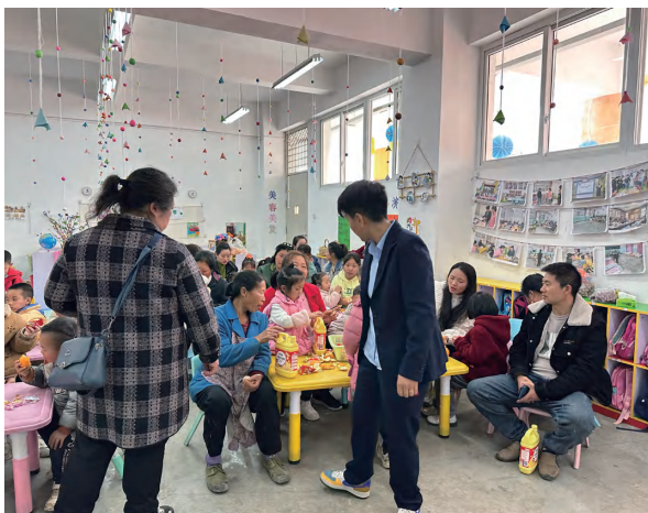
幼儿班“家长开放日”活动