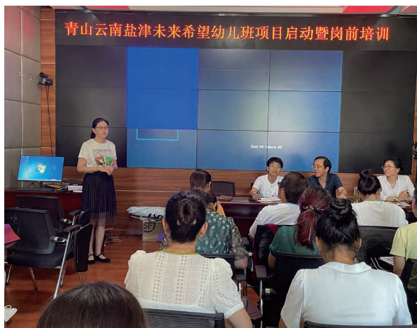
项目启动暨岗前培训会议