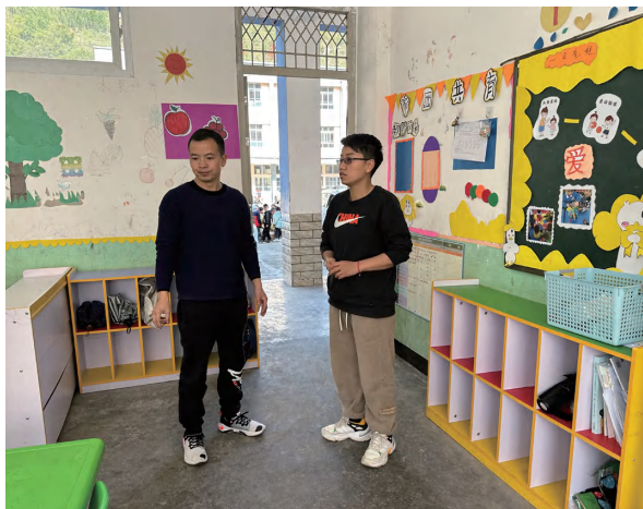
项目人员督导过程中与校长沟通