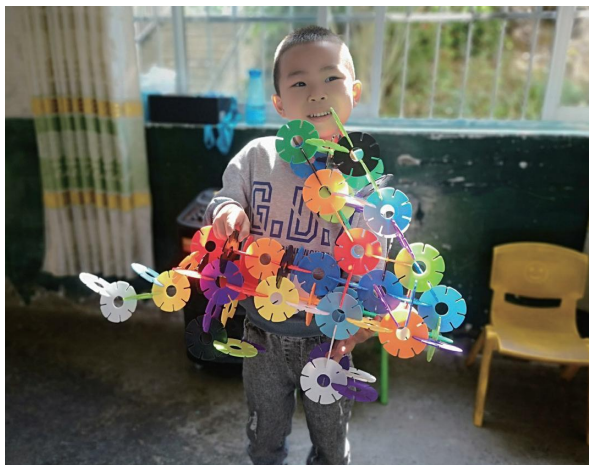
小朋友用雪花片组装了机器狗