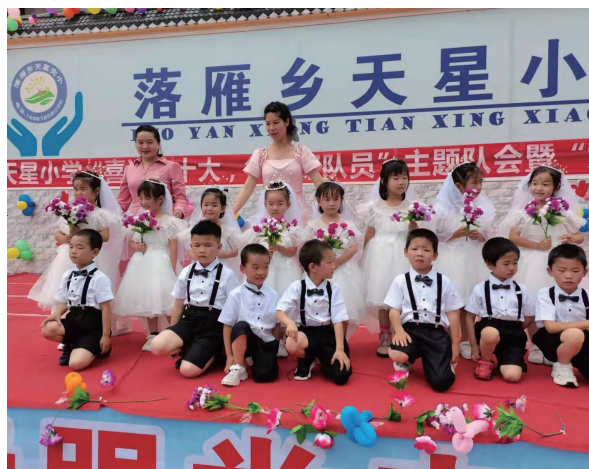
幼儿班举行大型活动——庆六一