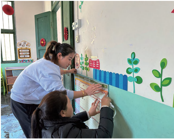
项目督导，协助教师粘贴学生收获园地